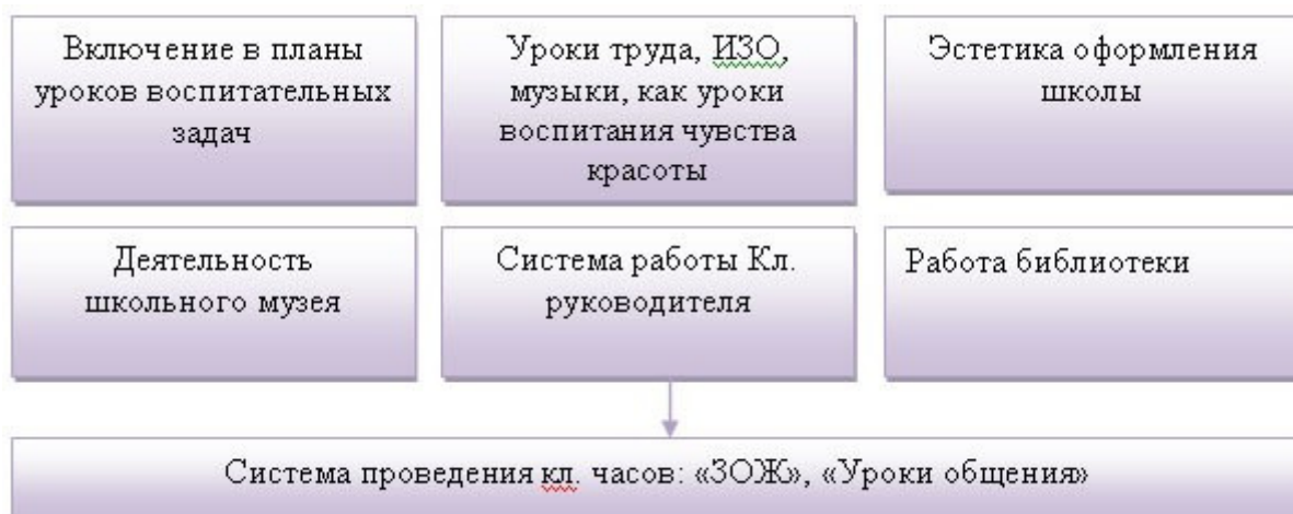
Рис. Пути реализации программы «Дорога к человечности»