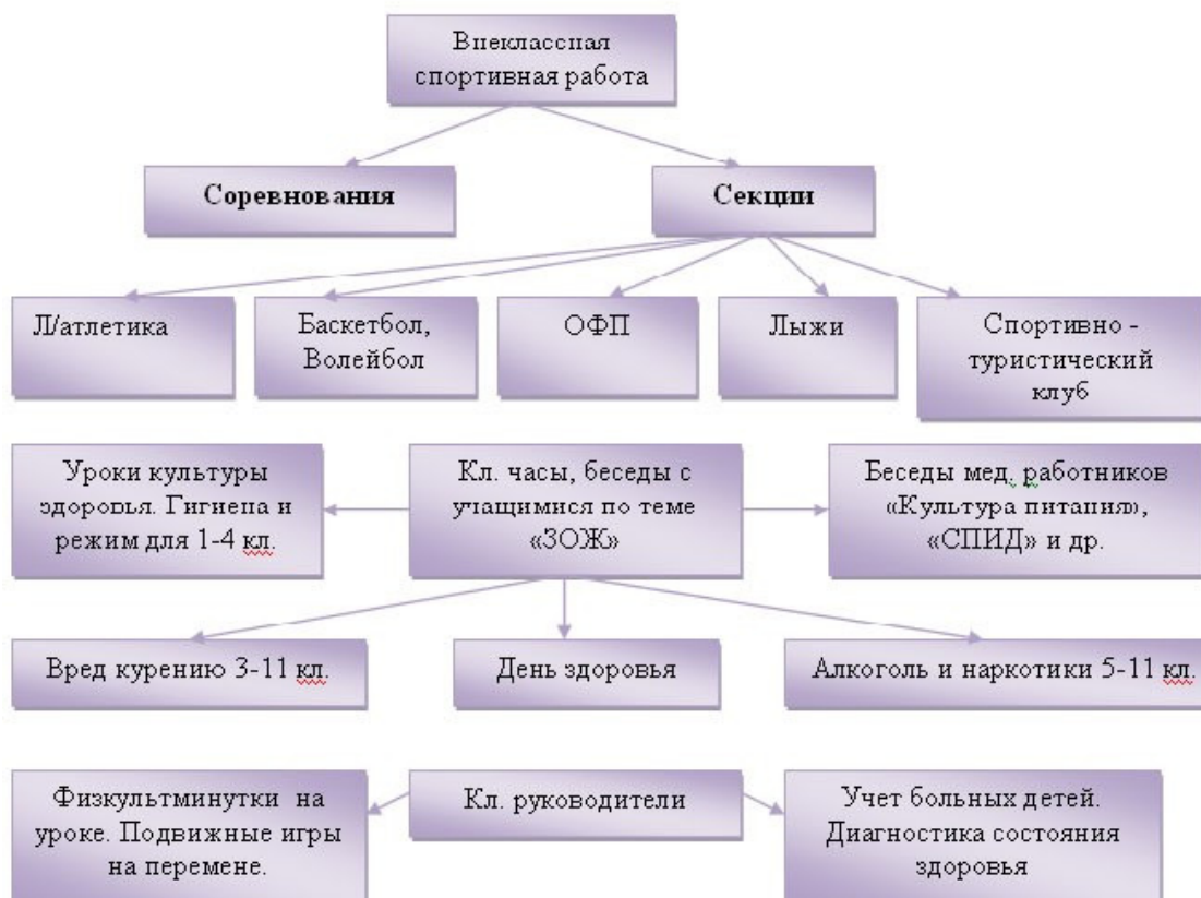
Рис. Пути реализации подпрограммы «Счастливо жить - здоровым быть!»

Воспитывать стремление к сохранению и укреплению здоровья, развитию и совершенствованию необходимых способностей, качеств и свойств личности.