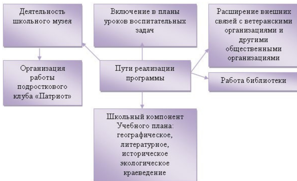
Рис. Пути реализации программы «Наш дом - Россия»